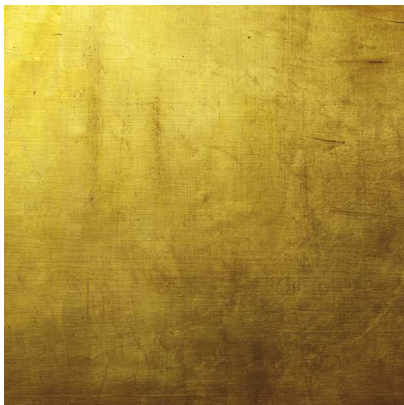
Illustration: Daniel Lienhard

Man möchte davor verschont bleiben: die Angst, der Streit, die Bedrängnis, die Belastung, das Leid, das Sich-verloren-Gehen, die Sinnlosigkeit. Wir mögen nicht die Schattenseite des Lebens, den Abgrund, der in die Zerstörung führt. Doch gehört der Schatten zum Licht, gehört zum Leben. Wo lernen wir, damit umzugehen? Woher nehmen wir die Kraft? Wie kann ich mich und andere schützen und stützen?